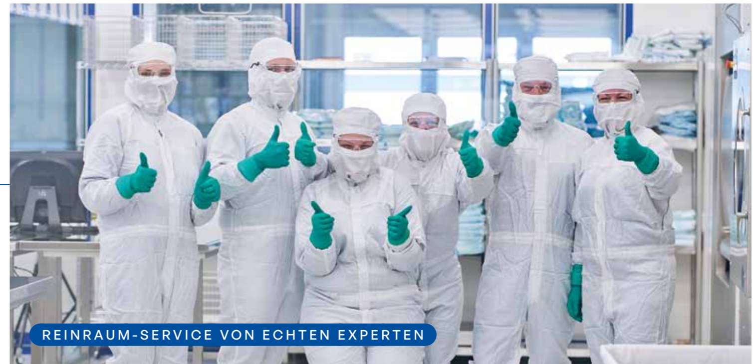
REINRAUM-SERVICE VON ECHTEN EXPERTEN