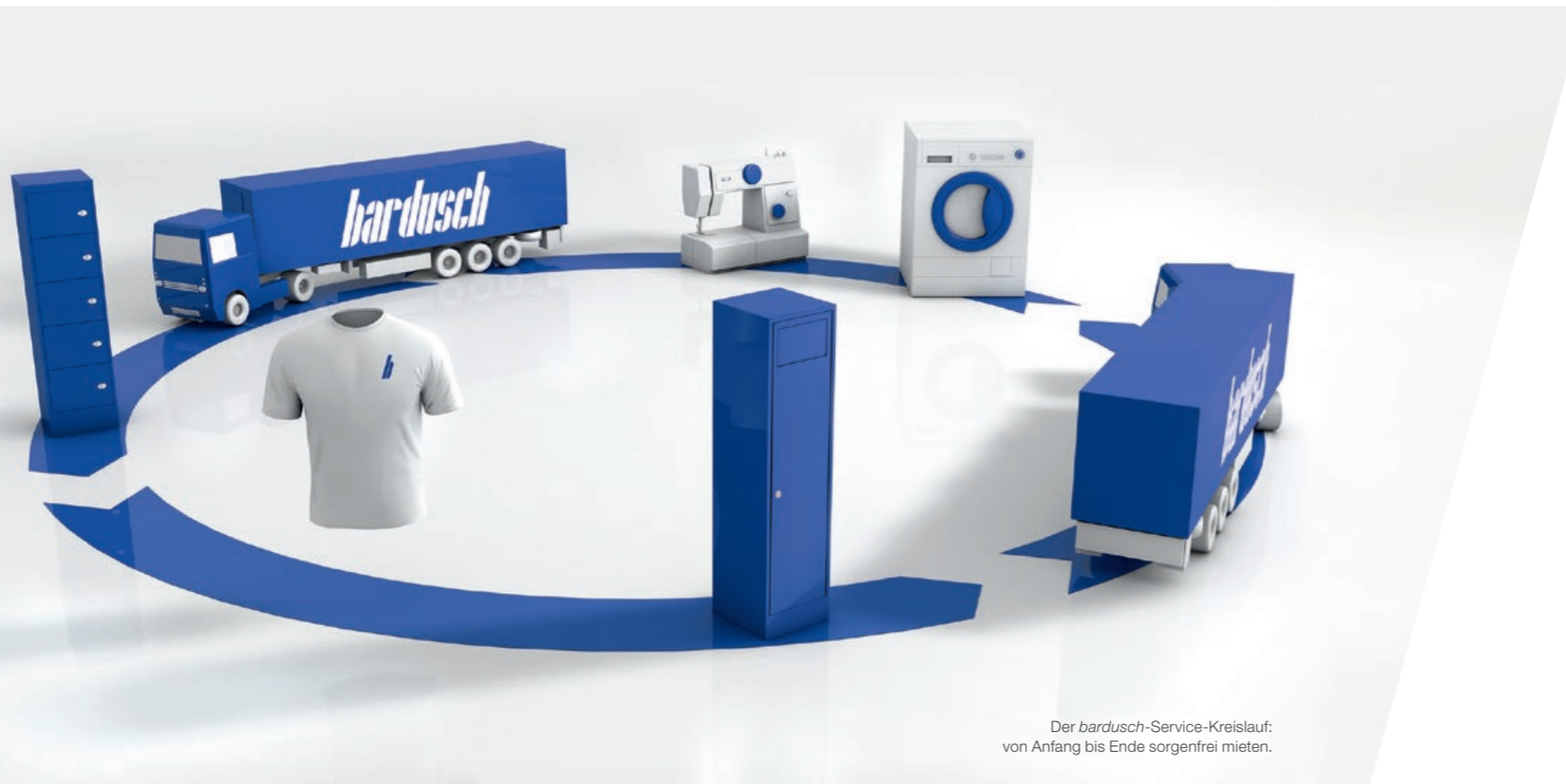
Der bardusch -Service-Kreislauf: von Anfang bis Ende sorgenfrei mieten.

Der Textilservice von bardusch gibt Ihnen auf diese Fragen eine umfassende und wirtschaftliche Antwort. Von der Ermittlung der optimalen Arbeitskleidung über die individuelle Mietfinanzierung, die fachgerechte Wäsche und Pflege bis hin zur pünktlichen Lieferung. So senken Sie wirkungsvoll Ihre Kosten und gewinnen mehr Sicherheit sowie finanzielle Spielräume.