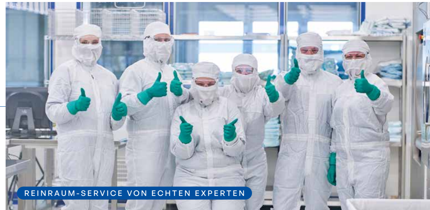
REINRAUM-SERVICE VON ECHTEN EXPERTEN

Erprobte Belieferung über NL «Mülheim-Kärlich» inklusive etablierte Zoll-Prozesse